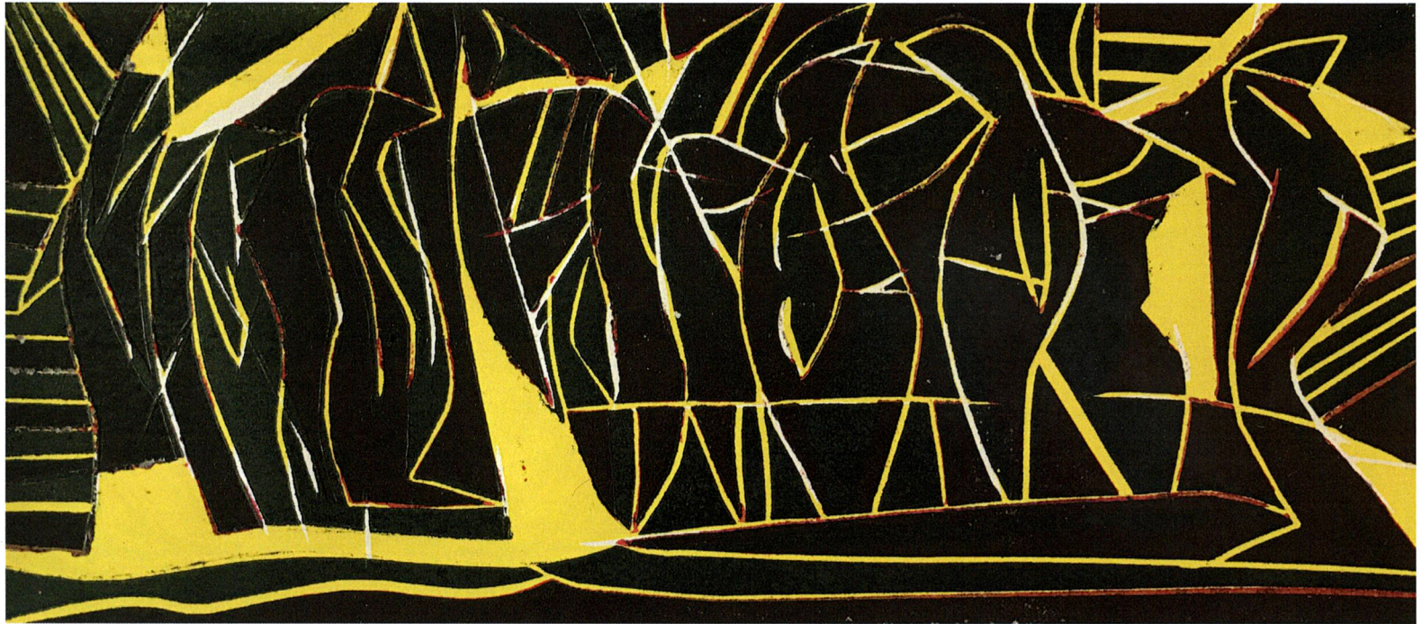
1/6 Xilografía Taco Perdido 20 x 40